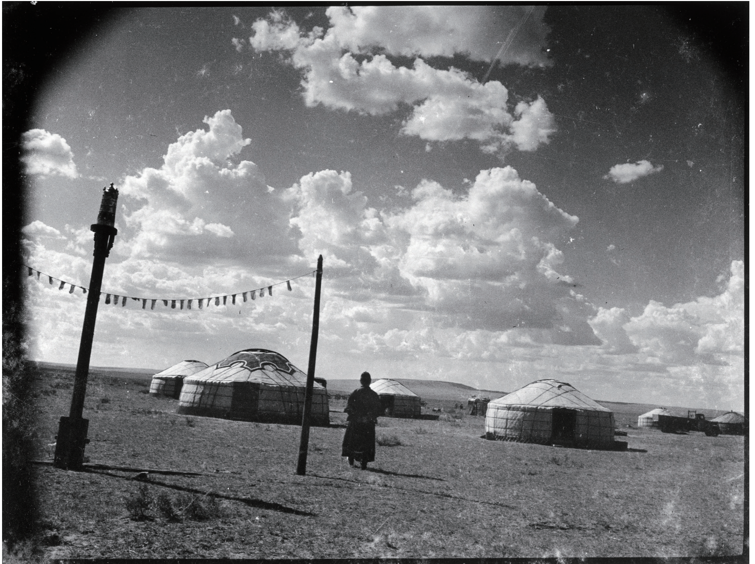
[阿巴嘎(アバガ)大王府]