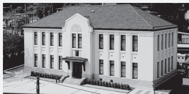
福島市写真美術館 (通称: 花の写真館)