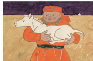
大塚勇三再話、赤羽末吉画「スーホの白い馬」(福音館書店、1967年) 表紙とエンゲラフ(部分)