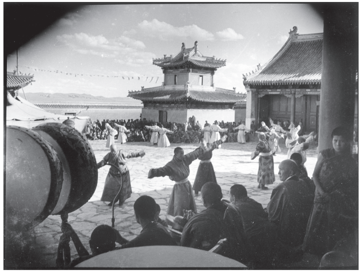
チヤムの予行演習[貝子廟]

本展では、赤羽末吉が絵本画家の視点で捉えたモノクロ写真等約90点を展示いたします。